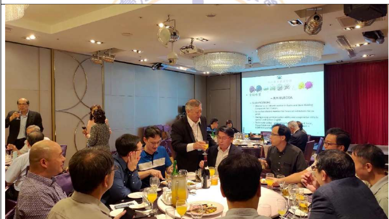
理監事聯席會議結束後-晚宴活動