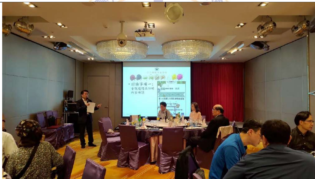
第 13 屆第三次理監事聯席會議-討論事項