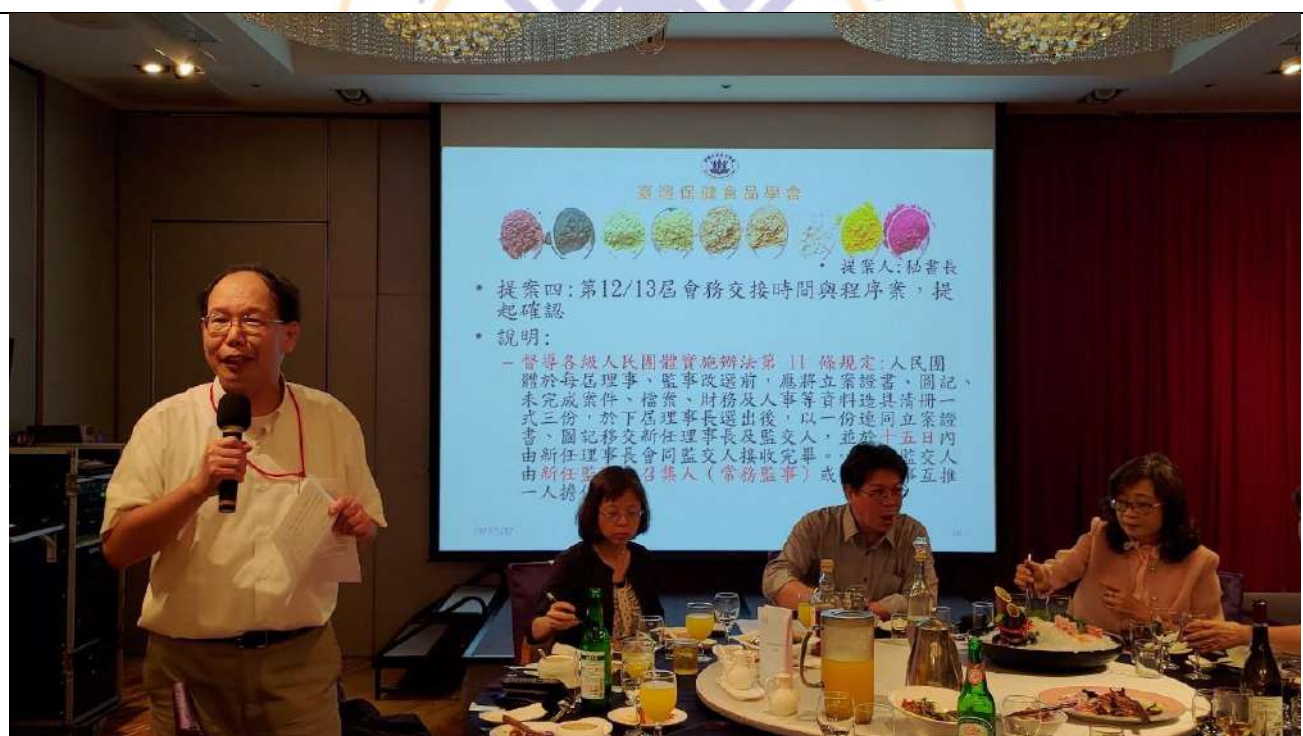
第 12 屆及第 13 屆「會務交接」事項說明及確認