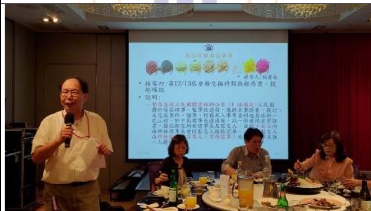
第12屆及第13屆「會務交接」事項說明及確認