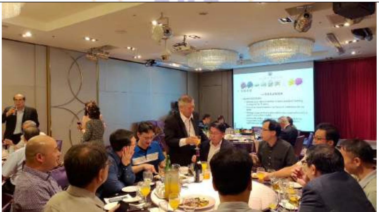
理監事聯席會議結束後-晚宴活動