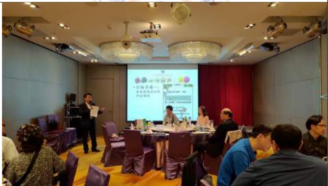
第 13 屆第三次理監事聯席會議-討論事項